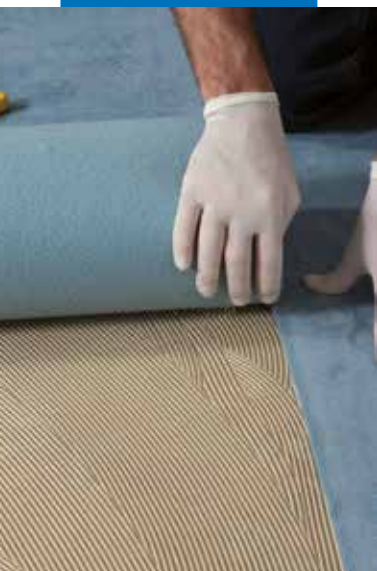
Padlószőnyeg burkolat fektetése