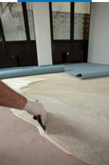
Ultrabond Eco 170 felhordása