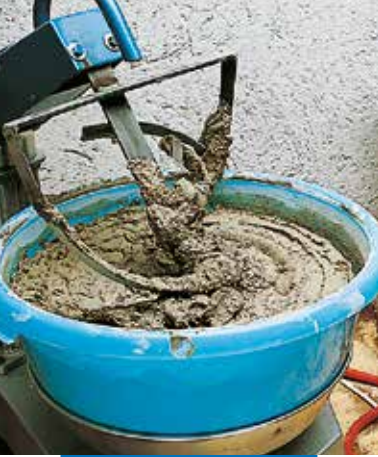
Bekeverés mini betonkeverővel