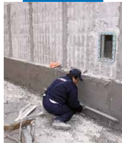
A vakolat lehúzása vakolóléccel

A termékre vonatkozó referenciák kérésre rendelkezésre állnak, illetve hozzáférhetők a www.mapei.hu és www.mapei.com honlapokon