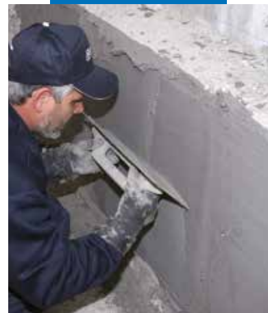
A Nivoplan bedolgozása simítóval