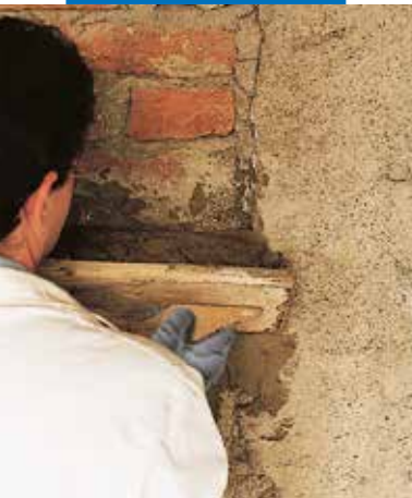
Régi téglafalazat helyreállítása