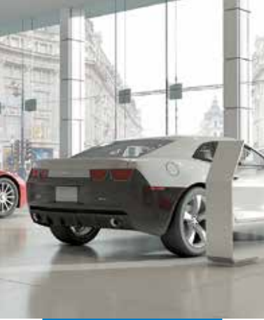
Mapetex System-mel fektetett fal- és padlóburkolat