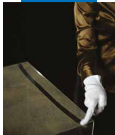
Hagyományos cementkötésű termékkel