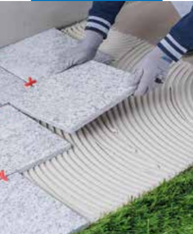
Természetes kövek ragasztása kültéren