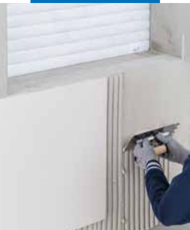
Nagyméretű kerámia lapok ragasztása