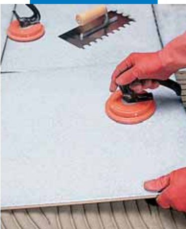
Nagyméretű burkolólapok fektetése