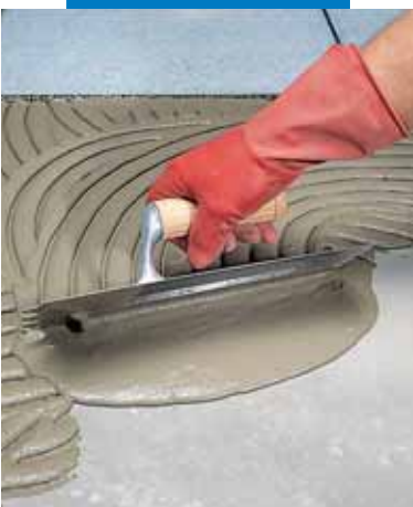
Terítés félköríves fogú simítóval