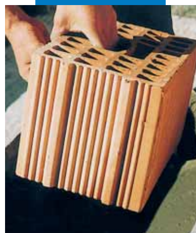
Falazóblokk mártása Adesilex P4-be