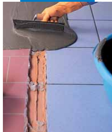
Meglévő padlóburkolat simítása Adesilex P4-gyel