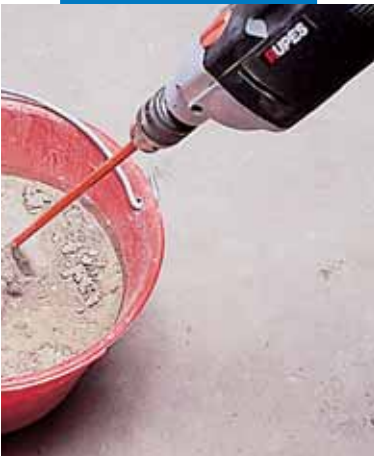
Adesilex P4 bekeverése

A felület miután járhatóvá vált (a hőmérséklettől