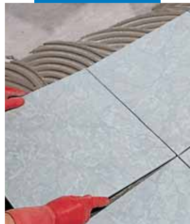
Porcelán burkolólapok fektetése